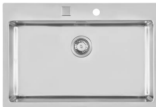
Lavello KE Sopratop I Filotop 2266 050