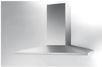
Cappa d'aspirazione Amélie 2447 090