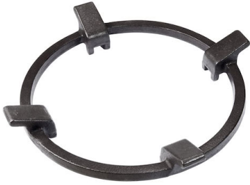
Porta Wok in Ghisa 9601 727